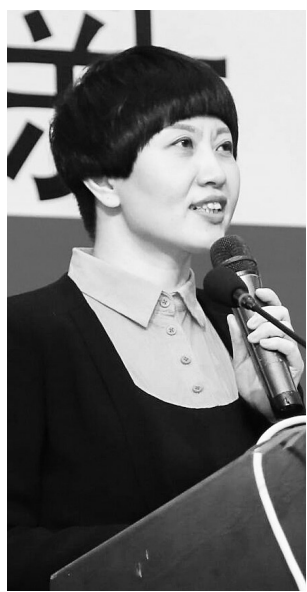
【突破学科中心、教师中心、教材中心,更好地回归儿童立场,回归孩子们和老师们的校园生活常态,改良校园生活方式和整个小学的教育形态】

在海亮教育集团,我做的第一件事是推出“英才行动计划”。“钱学森之问”如何求解?为什么我国有着世界最大规模的博士教育和大规模的基础教育,却没有能够培养出优秀的拔尖人才?我们能否通过教育实践解决这个难题。习近平总书记说,“让每个人都有人生出彩的机会”。这启示我们:每一个孩子、每一个孩子的生命都要受到尊重,每一个孩子都有生命出彩