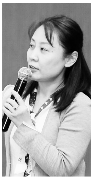
【通过共同体学习,我们真正关注每一个不同的个体,每一个有差异的个体,每一个有差异的个体。作为校长,一定要在真正的教学实践中得到磨炼,成为喜欢课堂、亲近课堂的学校首席教师】

教育要让每一个孩子都有权利学习。在课堂上,我们尤其要关注每一个不同的个体,每一个有差异的个体。如何做到关注每一个个体?在我的班上,有自闭症儿童、智障儿童和有暴力倾向的孩子,我的班上集中了许多这样的特殊孩子,没办法教的孩子都交到我的班上。那么,怎样通过共同体学习保障每一个孩子的权利?