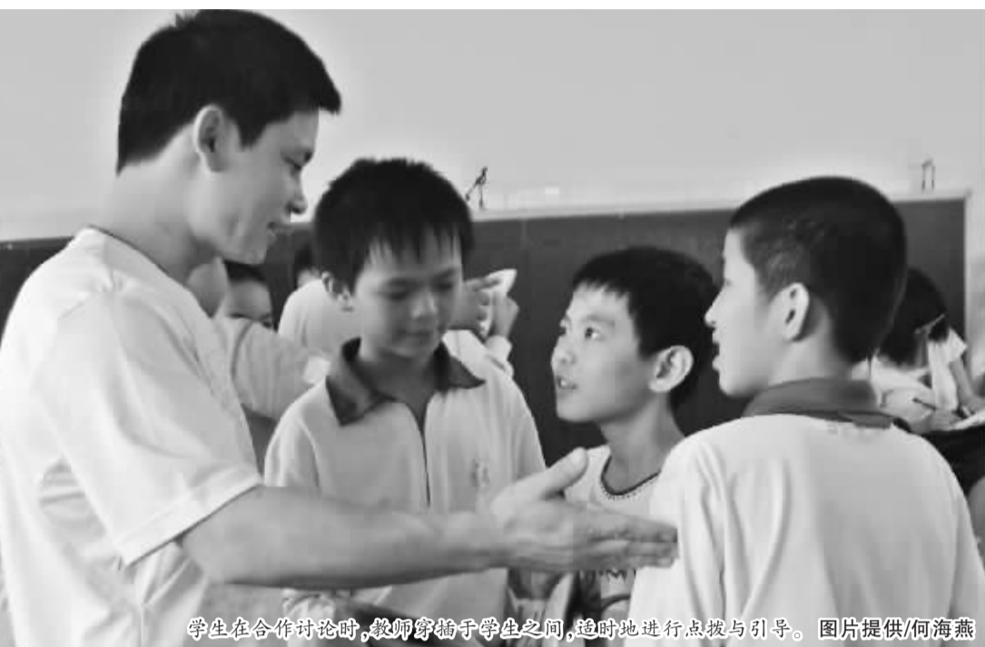
学生在合作讨论时,教师穿插于学生之间,适时地进行点拨与引导。