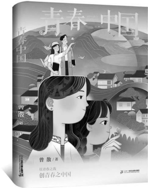
《青春中国》曾散 著 二十一世纪出版社集团

在他们发来的简简单单的介绍里可以看出，他们都有着值得被书写、被记录的故事：前脚刚风华正茂地走出象牙塔，没有去憧憬在广阔的天地间大展拳脚，而是投身到更为广阔的天地里发光发热，这本身就故事性十足。随着采访的时间增长，我得知了更多志愿者服务西部的故事。这是一个蓬勃向上的群体，是一群敢于有梦、勇于追梦、勤于圆梦的热血青年，在人生最美好的年华里，把青春和热爱融入这个百年未有之大变局的伟大时代，用所学回馈社会，为脱贫攻坚、为乡村振兴奉献自己的一份力量。这力量就算微小，就算只是一时，却都为当地带来了些许可喜的变化。心有他人的奉献精神、扎根大地的大爱情怀、积极进取的奋斗精神，还有什么比它更能代表我们新时期广大青年的精神面貌呢？